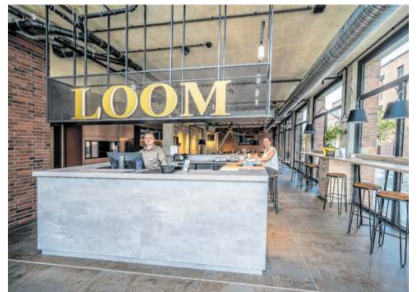
Das ist die Rezeption des neuen Hotels „Loom“ in der Buntweberei.