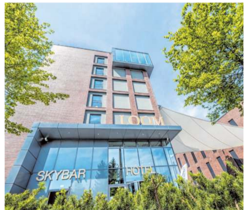
Hotel und Skybar haben jeweils eigene Eingänge.