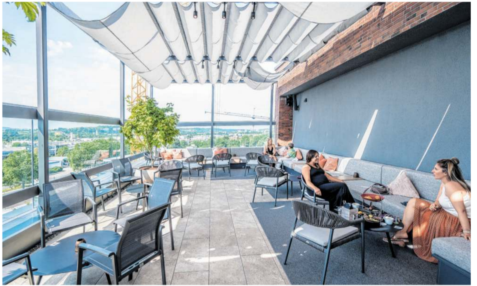
Hoch über den Dächern der Stadt: die Skybar der Buntweberei in Eisingen.