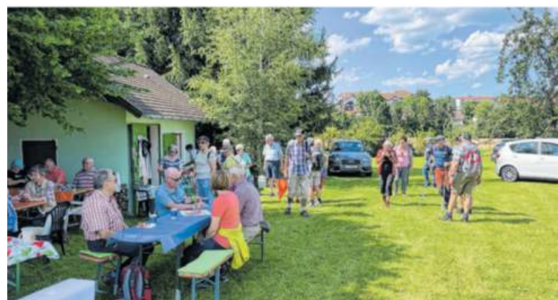
Der Abschluss fand auf Tiederles Wiese statt.

Süßen. Nach dem langen Lockdown sind die Süßener Senioren und Freizeitwanderer zu ihrer ersten gemeinsamen Wanderung gestartet. Nach der Tour durch den Schlater Wald gab es den Abschluss auf Tiederles Wiese. Die Wander-Guides bedankten sich bei den Organisatoren für die Bewirtung der 58 Teilnehmer und erklärten, dass es diesmal nichts koste, man aber sehr dankbar wäre für eine Spende, die in das Katastrophengebiet des Ahrtals geht. So kamen mehr als 500 Euro zusammen, die von der Kolpingfamilie Süßen an die Kolpingfamilie in Ahweiler überwiesen werden.